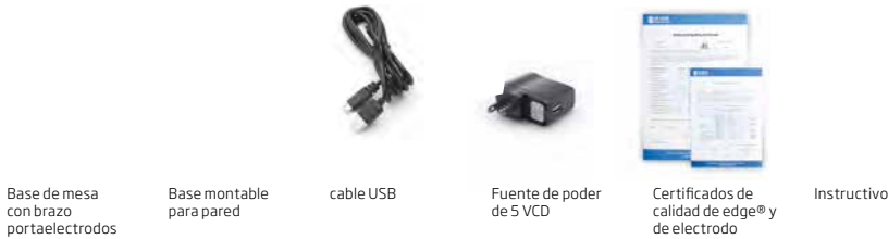
Base de mesa con brazo portaelectrodos Base montable para pared cable USB Fuente de poder de 5 VCD Certificados de calidad de edge® y de electrodo Instructivo

Además se incluyen los siguientes accesorios, específicos para cada modelo: