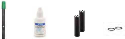
HI764080 Sonda de oxígeno disuelto HI70415 Solución electrolítica de relleno 2 cartuchos de membrana para OD O-rings para cartucho de membrana (2 pzas)

Kit edge® para OD: HI2040-01 (115V) y HI2040-02 (230V) incluyen: