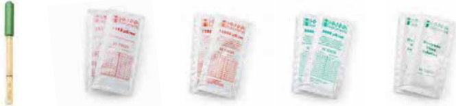
HI763100 Sonda de conductividad 4 sobres de conductividad estándar de 1413 µS/cm 2 sobres de conductividad estándar de 12880 µS/cm 2 sobres de conductividad estándar de 5000 µS/cm 2 sobres de solución de enjuague para electrodo

Kit edge® para CE: HI2030-01 (115V) y HI2030-02 (230V) :