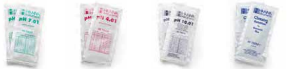
HI11310 Electrodo de pH rellenable con cuerpo de vidrio 4 sobres de solución buffer para pH 7 2 sobres de solución buffer para pH 4 2 sobres de solución buffer para pH 10 2 sobres de solución limpiadora para electrodo

Kit edge® para pH: HI2020-01 (115V) y HI2020-02 (230V) incluyen: